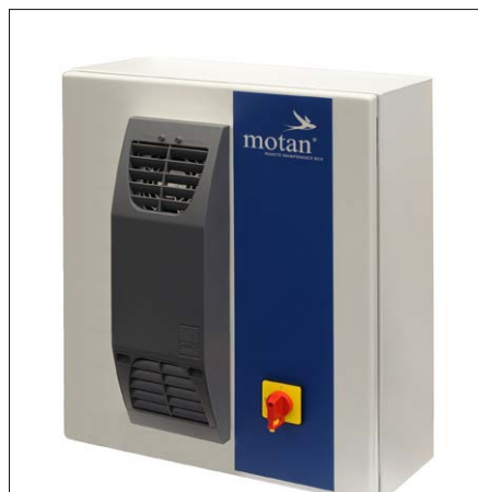
Die Remote Maintenance Box – eine einfache und sichere Lösung für die digitale Wartung und Pflege von Systemsteuerungen.

Die in vielen anderen Systemen verlangte komplexe Freischaltung und Administrati-