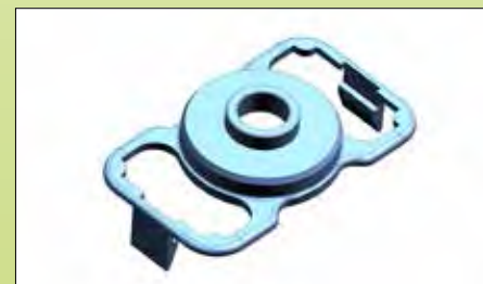
Modèle CAD de la pièce test.